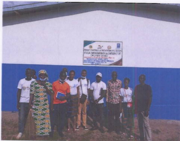
Figure 7: Le personnel et les populations du village de Zoutouo Dara fiers de poser devant leur dispensaire rural réhabilité