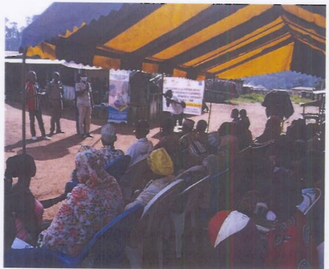
Figure 4: Sensibilisation de masse sur la cohésion sociale à Danané avec l'appui du Sous-Préfet

Les activités de masse sont des activités au cours desquelles les relais communautaires et d'autres participants (autorités traditionnelles et administratives) sensibilisent les communautés sur la cohésion sociale, la nécessité de la cohabitation pacifique et d'autres thèmes d'intérêts publics (foncier rural, VBG). Ses sensibilisations sont réalisées à travers des focus groups, le théâtre participatif, les activités culturelles et sportives, les émissions radiophoniques avec la collaboration des radios de proximité l'objectif principal étant l'atteinte du plus grand nombre de personnes possibles.