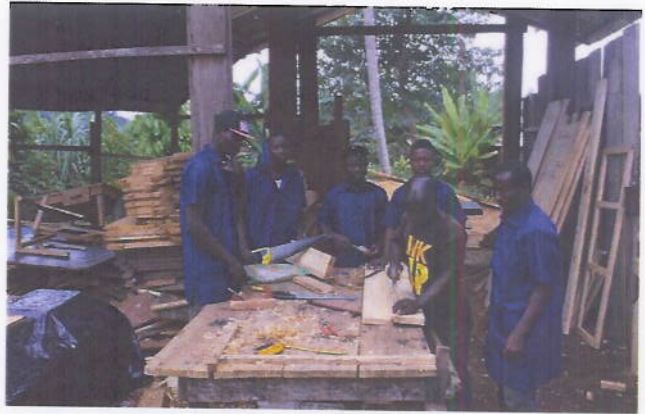
Figure 11: 05 Jeunes placés en formation de menuiserie chez un maître artisan à Toulepleu