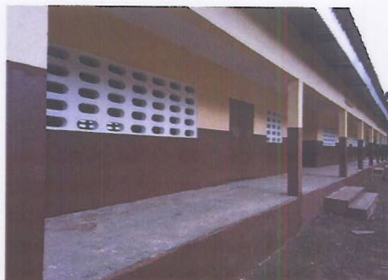
Figure 6: Un bâtiment de 3 classes réhabilité à l'EPP Goutro

Dans les grandes localités de retour des personnes rapatriées, le projet accompagne la réparation communautaire en procédant à la réhabilitation d'infrastructures sociales de base. Ceci a pour objectif de renforcer la cohésion sociale par le renforcement du dialogue entre les communautés à travers un meilleur accès