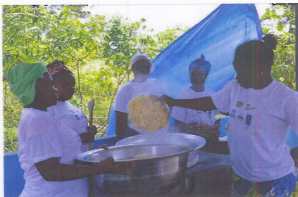
Figure 9: Unité de production moderne d'Attiéké au profit d'une association de femmes de Yocobo 2 (Département de Tabou)