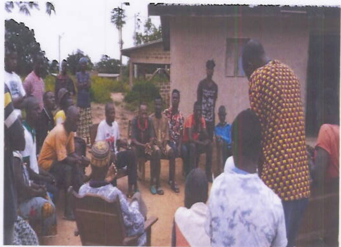
Figure 3: Echanges pour la résolution d'un conflit communautaire dans le village de Goya 1 (Département de Guiglo)

2 cas de VBG (Viol) et 1 cas de protection (maltraitance d'enfant) ont été assistés avec l'appui des comités de paix à Tabou. La Prise en charge médicale a été assurée et les cas référés au centre social pour la prise en charge judiciaire et psychosociale. Le comité a pu noter avec satisfaction que pour les deux cas de viol les auteurs ont été condamnés et emprisonnés.