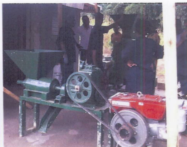
Figure 14: Des jeunes entrepreneurs assistés dans la production de savon à base d'huile de palmiste