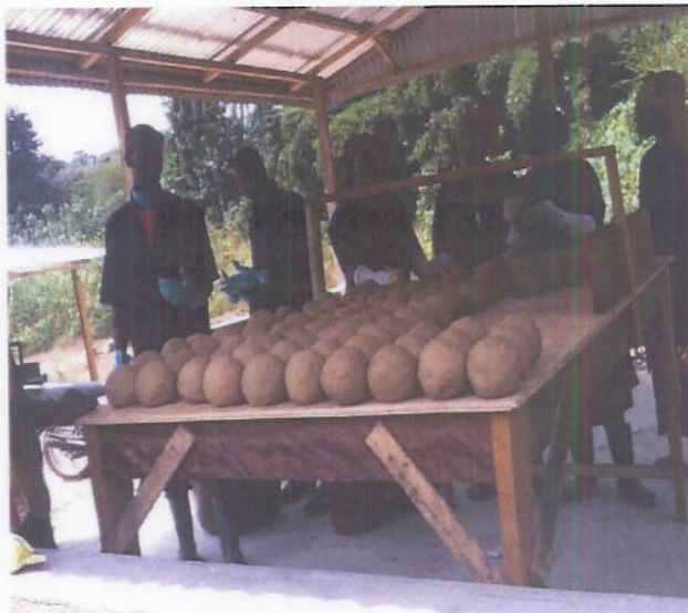
Figure 8: Fabrication de savon artisanal à partir de l'huile de palmiste dans le village de Boueugleu (Département de Danané)

Le processus de réintégration des personnes rapatriées a continué et s'est accéléré cette année avec un renforcement du dispositif opérationnel de mise en œuvre avec 9 PMO. La réintégration a concerné principalement des activités (i) d'identification et de renforcement des capacités des rapatriés et des communautés hôtes, (ii) de mise à disposition d'activités génératrices de revenus permettant d'améliorer leurs revenus et leurs conditions de vie, la formalisation et légalisation des OCB en groupement d'intérêts économiques créés.