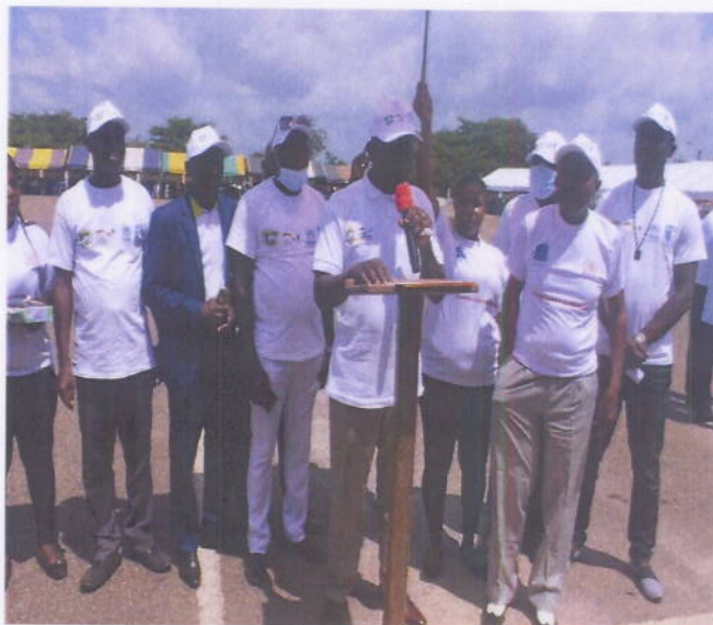
Figure 5: Organisation d'une journée de la paix à Guiglo le 24 Octobre 2020