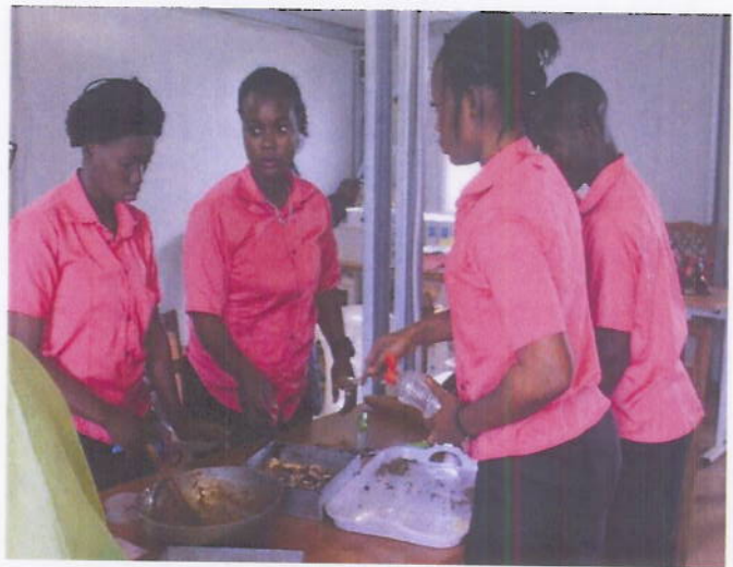
Figure 12: 05 jeunes en formation de pâtisserie avec l'appui de l'IFEF de Toulepleu