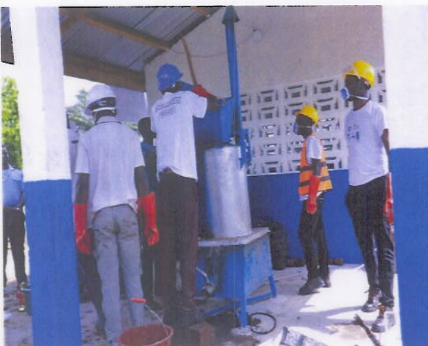
Figure 13: 15 jeunes entrepreneurs accompagnés dans le recyclage de déchets plastiques en pavés à Tabou