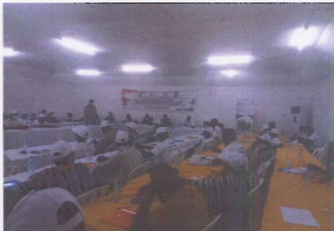
Figure 1: Atelier de formation des autorités traditionnelles et leaders d'opinion sur la cohésion sociale à Guiglo du 22 au 23 Juillet 2020

comités de paix et des relais communautaires outillés et disponibles pour le renforcement de la cohésion sociale.