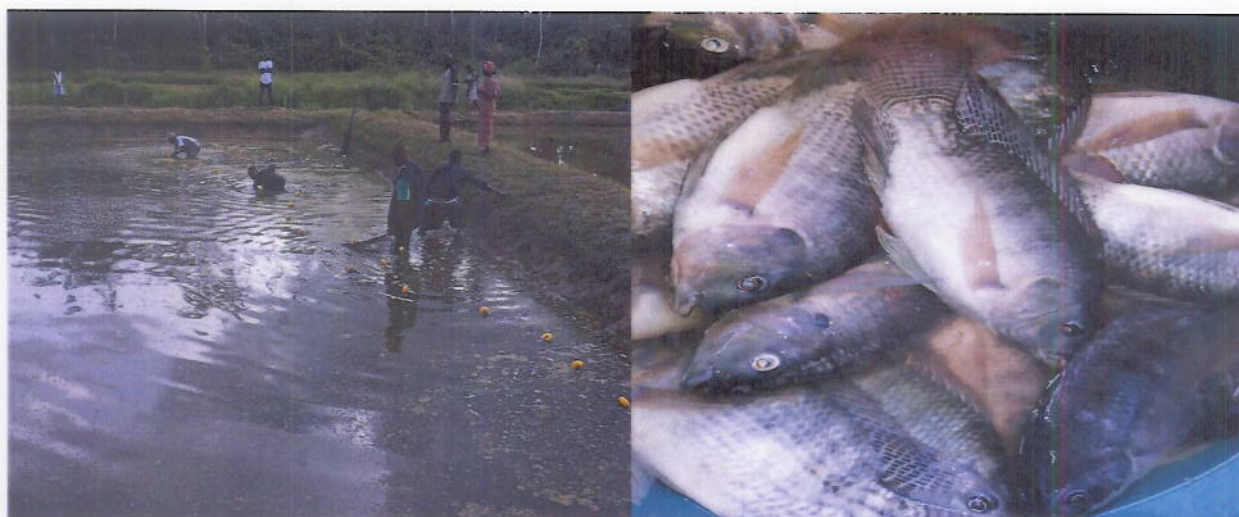
Figure 10: Des jeunes réintégré dans la pisciculture en pleine séance de pêche dans le village de Zéaglo (Département de Bolequin)