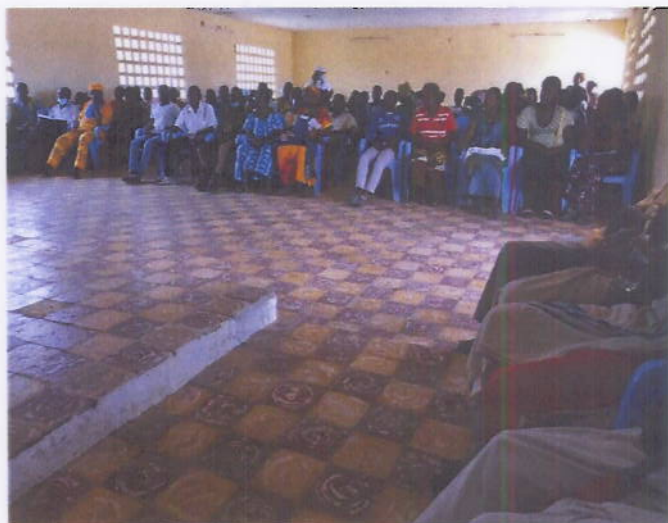
Figure 2: Organisation de dialogue communautaire à Toulepleu

En définitive, pour l'année 2020, Le dialogue communautaire a été renforcé dans les localités de retour des personnes rapatriées à travers l'organisation de 35 séances de concertation et d'échanges communautaires dans 32 villages